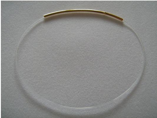
Halsreif aus Nylon mit goldfarbigem Steckverschluss